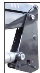
Loader quick release system Sgancio rapido senza perni